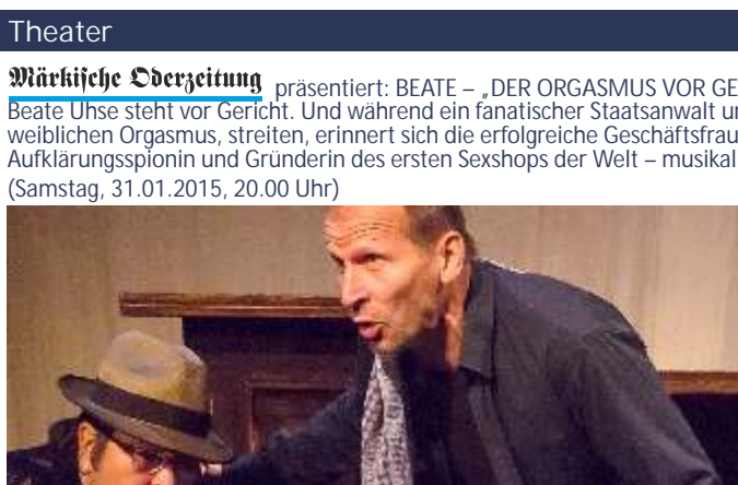
„GOTT IST ZU LANGSAM“

BEATE – „DER ORGANISMUS VOR RICHTER“ Gastspiel der Uckermärkischen Bühnen Schwedt Beate Uhse steht vor Gericht. Und während ein fanatischer Staatsanwalt und ein findiger Verteidiger über das Recht auf Liebe und die Natürlichkeit, vor allem des weiblichen Organismus, streiten, erinnert sich die erfolgreiche Geschäftsfrau an ihr bewegtes Leben, das sie bis auf diese Anklagebank führte: Pilotin, Geschäftsfrau, Aufklärungspionierin und Gründerin des ersten Sexshops der Welt – musikalisch unterlegt mit allem, was das 20. Jahrhundert zum S(w)ingern brachte... (Samstag, 31.01.2015, 20.00 Uhr)